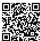
Official Notice Board